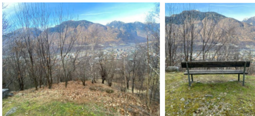
Figura 12: Punto panoramico con panchina da sostituire

Si prevede di liberare un punto panoramico di interesse lungo il sentiero della Via Crucis, attraverso un abbattimento mirato degli alberi. Questi verranno sostituiti da arbusti, che rimarranno di altezza limitata, creando allo stesso tempo una copertura del suolo che prevenga la diffusione di altre specie indesiderate nell'area.