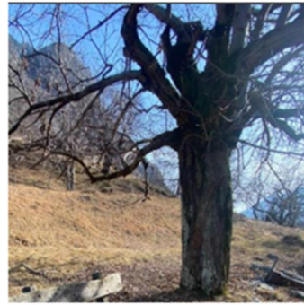
Figura 8: Castagno deperito in prossimità di una panchina