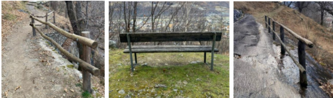
Figura 13: esempio di infrastrutture presenti nella selva da sostituire

Il legname proveniente dal taglio e la ramaglia saranno esboscati tramite elicottero, scelta motivata dalla difficoltà di accesso alla selva e dalla necessità di minimizzare i rischi di diffusione di specie indesiderate.