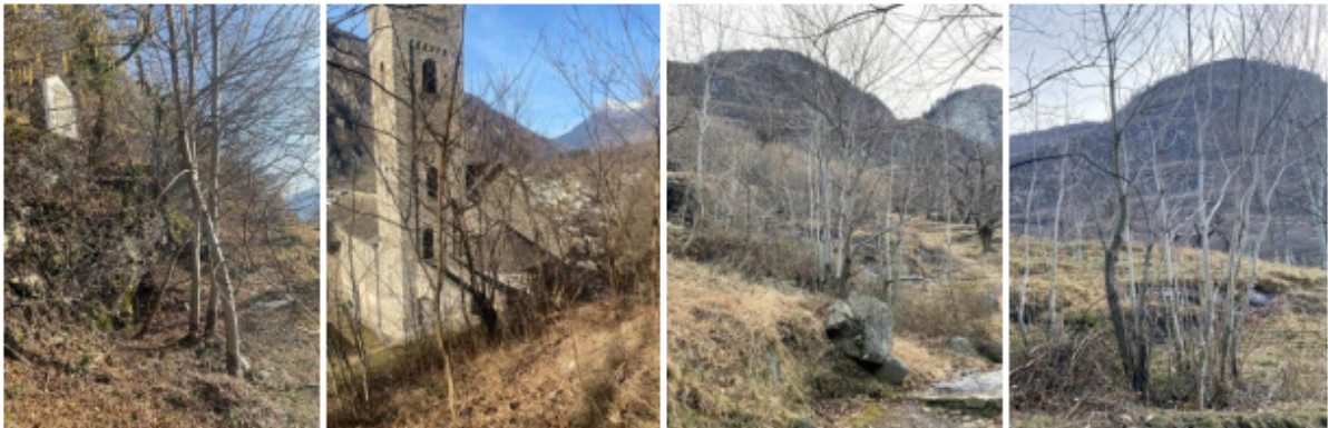
Figura 9: Frassini e robinie presenti nell'area di recupero della selva

Abbattimento e rimozione degli alberi estranei alla selva (per esempio frassini e robinie).