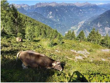
Pascolo di Chierisgeu