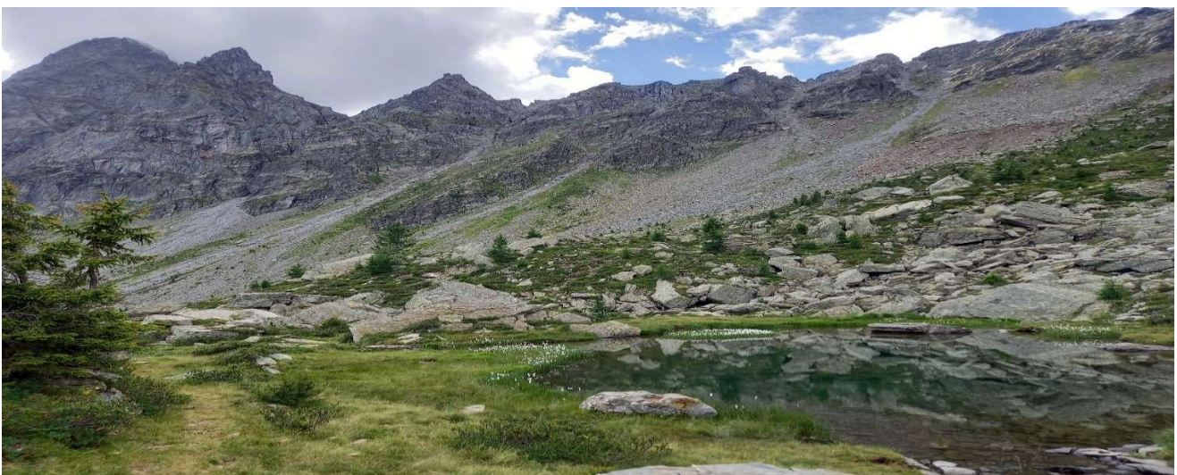
Alpe Cava 8.2024

Come abbiamo ricordato in apertura il 2025 sarà un anno elettorale. Sarà la presentazione del consuntivo il momento più indicato per un approfondimento sull'andamento del quadriennio. Per il momento è buona e dovuta prassi ringraziare chi si è impegnato in questi quattro anni per il nostro Ente e augurare ai nuovi ( o vecchi) consiglieri un quadriennio ricco di soddisfazioni.